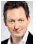
Dr. Eckart von Hirschhausen, Moderator und Kabarettist

18. Februar 2017 Barclaycard Arena Hamburg