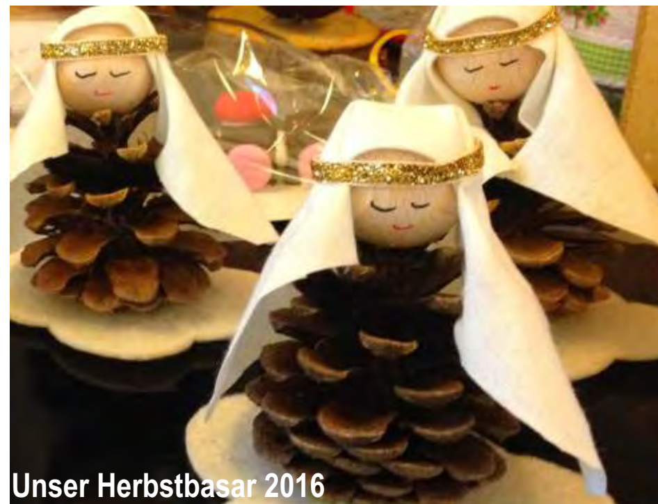
Unser Herbstbasar 2016